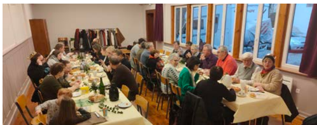
Galette des rois