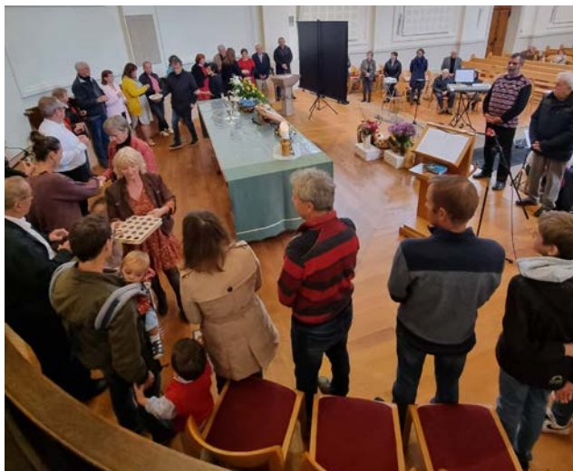
Sainte-cène culte des récoltes en octobre