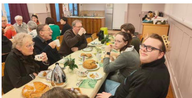
Galette des rois