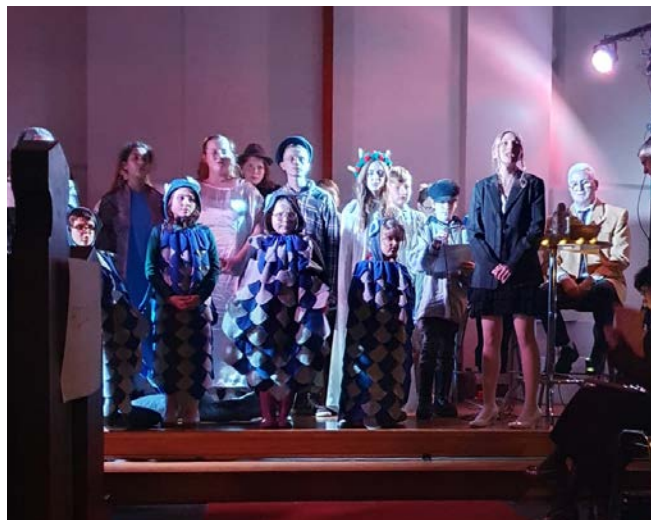
Spectacle de Noël à Benfeld