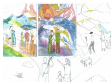
Projet de l'atelier créatif

Venez participer à l'élaboration d'un triptyque pour l'église ! L'atelier consistera en sa mise en couleurs en peinture acrylique. Le fond des supports (en drap de coton) ainsi que les contours seront réalisés préalablement