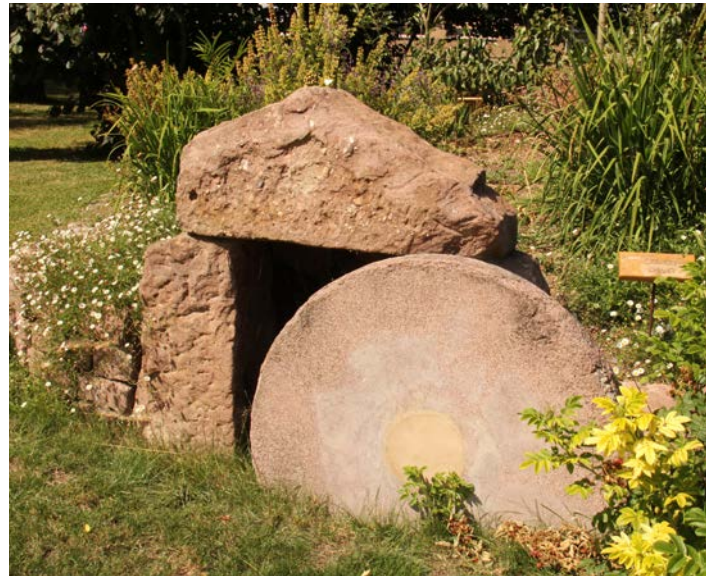
Jardin du CHEmin

Venez découvrir ce jardin inter religieux lors d'une visite guidée le vendredi 7 juin à 18H ou le samedi 15 juin à 10H. Inscriptions par mail haesslerjoelle@gmail.com jusqu'au 4 juin.