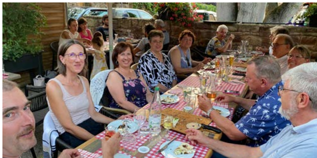
Repas de l'association des amis de l'Église à Fegersheim