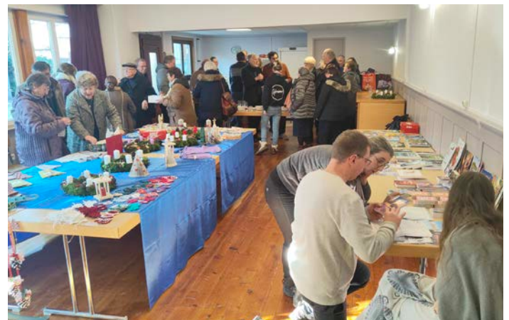
Fête de l'Avent au foyer

Il est possible de louer le foyer paroissial pour vos fêtes de famille et autres événements. Pour tout renseignement merci de nous contacter.