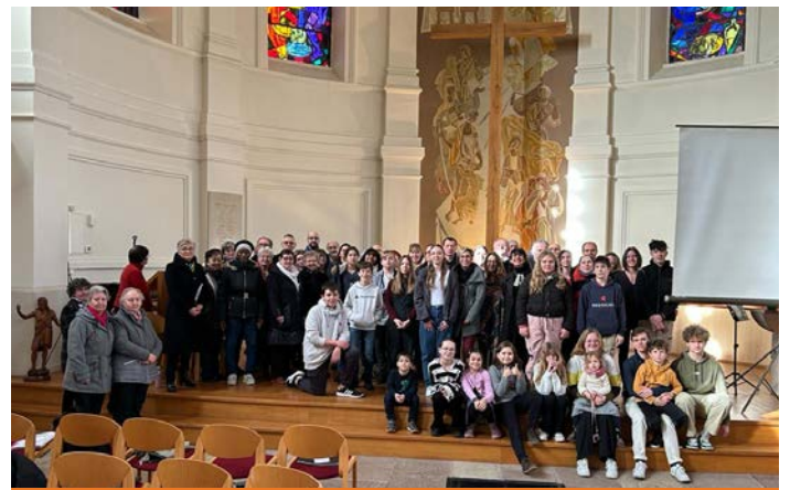
Culte du 4 février avec élections du CP

Une très belle participation : Merci à tous.