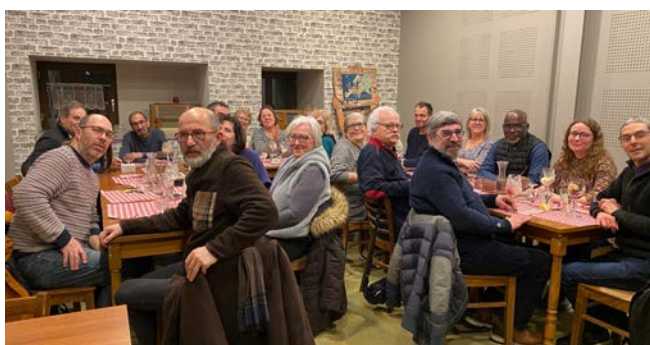
Repas de CP à Fegersheim