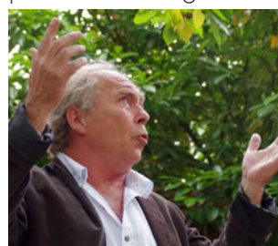
Spectacle Martin Bucer