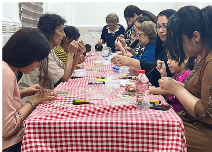
Formation artisanat des femmes en Irak

La situation varie beaucoup selon les pays mais elles font face à énormément de défis. Elles sont minoritaires et subissent, selon les cas, des discriminations ou des menaces existentielles liées à des conflits armés, des groupes islamistes fanatiques ou des conditions socio-économiques catastrophiques. Beaucoup de ces Églises voient leurs membres partir en exil et c'est une réelle souffrance. Pour autant elles font preuve de beaucoup de courage et d'espérance. Les Églises du Moyen-Orient sont les héritières du christianisme des premiers siècles. Elles jouent un rôle positif dans leurs sociétés en s'investissant dans des œuvres sociales et éducatives importantes, et en vivant un réel dialogue avec les différents courants de l'islam. Leur témoignage est fort et nous pouvons beaucoup recevoir de nos relations et échanges avec elles !