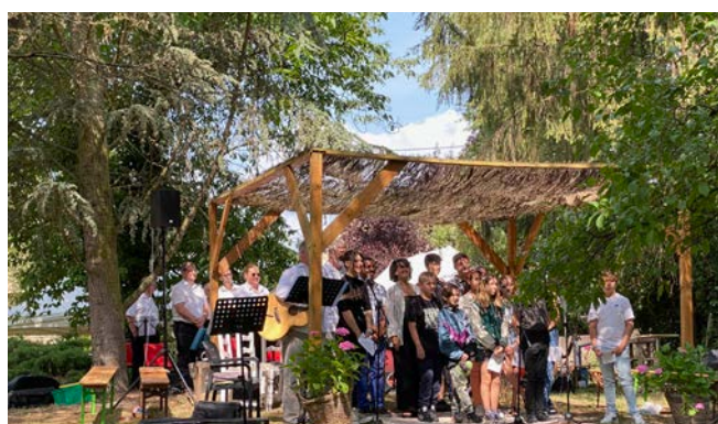
Culte en plein air