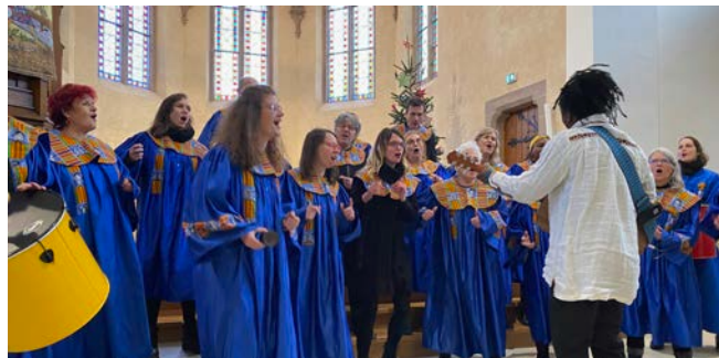
Concert de l'Avent