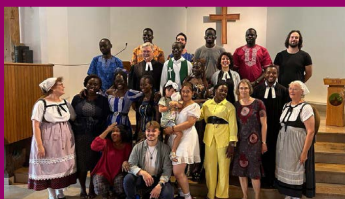
Rencontre franco-sénégalaise en août