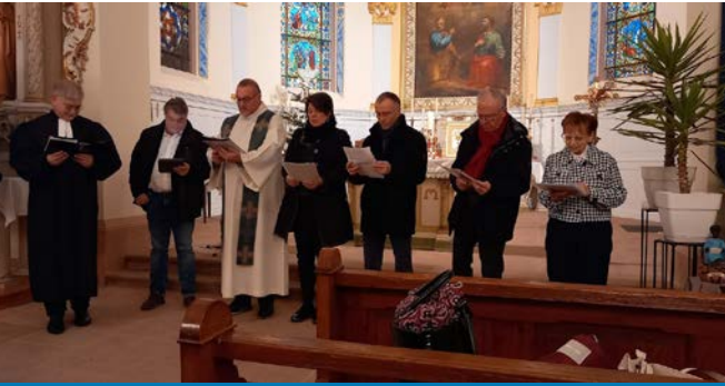
Célébration oecuménique à Uttenheim 19.01.25