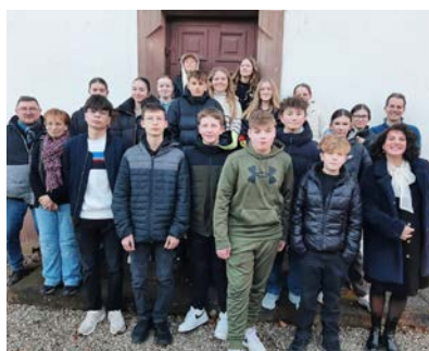
Kt journée œcuménique - 19 janvier

Seigneur, merci car je pense que tu ne nous abandonnes jamais, tu es toujours là même quand il nous arrive de ne pas toujours t'écouter. Alors comme tu nous l'as appris, nous te remettons nos inquiétudes pour l'avenir parce que nous savons tous que tu nous accompagneras à chaque épreuve, des plus simples aux plus dures. Nous te sommes éternellement reconnaissants pour ce que tu nous offres, ne serait-ce qu'un toit et de la nourriture. Nous te prions en ce jour pour les malades, les sans-abris, les personnes qui subissent ou qui affrontent la guerre, les personnes dans le deuil, les personnes dans la solitude et les personnes démunies. Nous savons certainement tous que la vie sera pleine d'amour, de joie, certainement aussi de défaite et de tristesse mais ce n'est pas grave parce que le plus important c'est de t'avoir à nos côtés à chaque instant, alors merci d'être toujours présent.