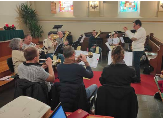
Fête de l'Avent avec le Posaunenchor