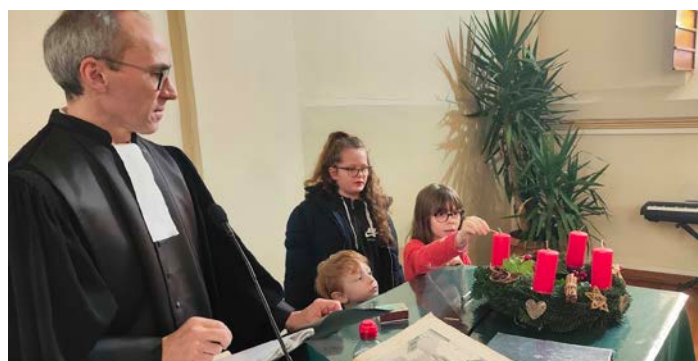
Fête de l'Avent