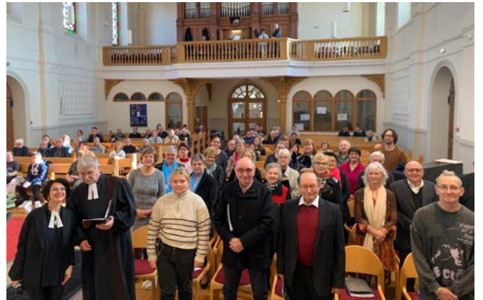
Culte octobre 24