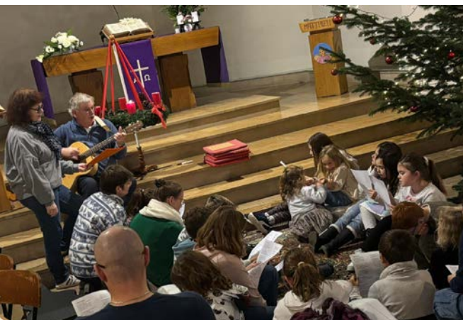
Noël des enfants à Gerstheim