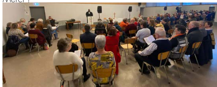
Culte du 1 er de l'Avent à Fegersheim