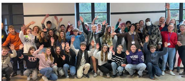
Weekend KT 25 février