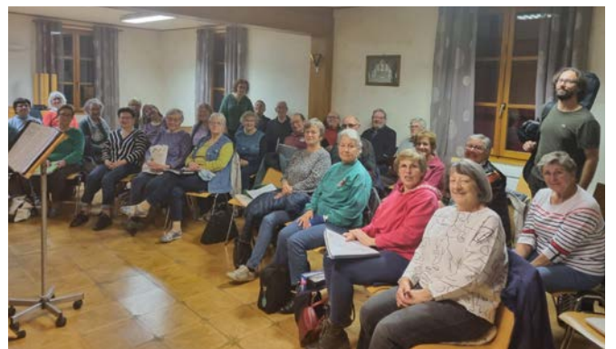
Chorale consistoriale Gerstheim