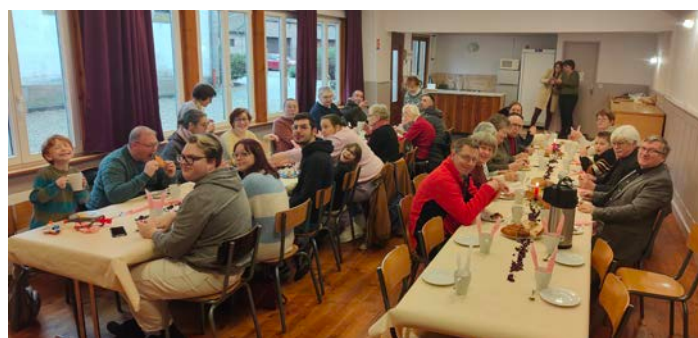
Galette des rois

« Tiens bon la vague et tiens bon le vent, hissez haut, Santiano, si Dieu veut toujours droit devant, je suis fier d'y être matelot ! »