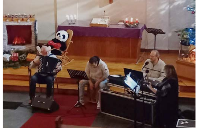
Chantons Noël 21.12.24