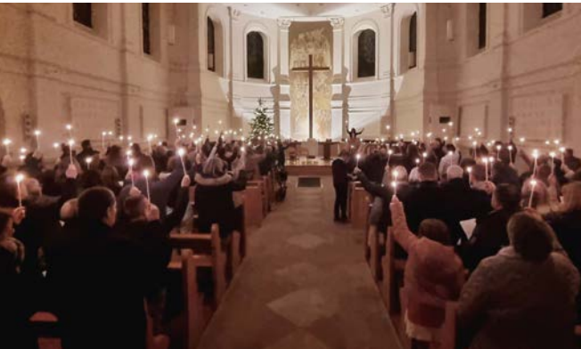
Culte de Noël