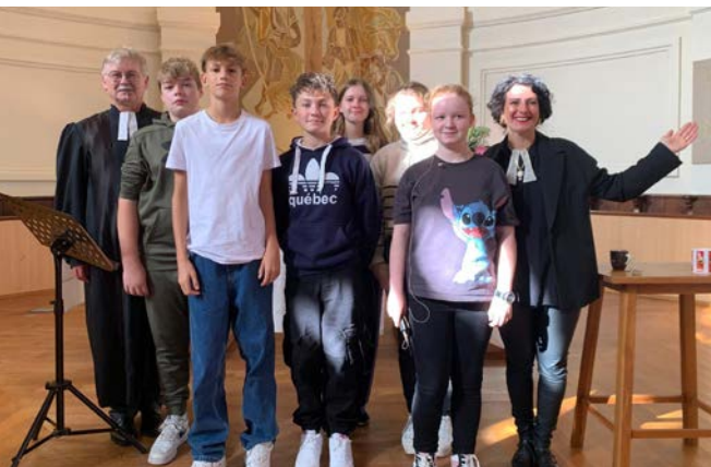
Culte de la Réformation 27 oct 24