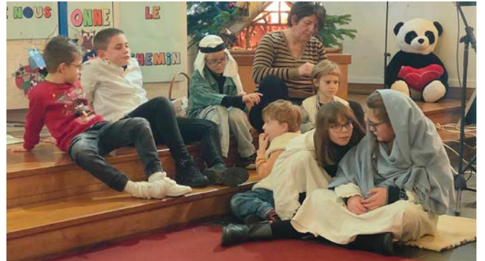
Veillée de Noël 24.12.24