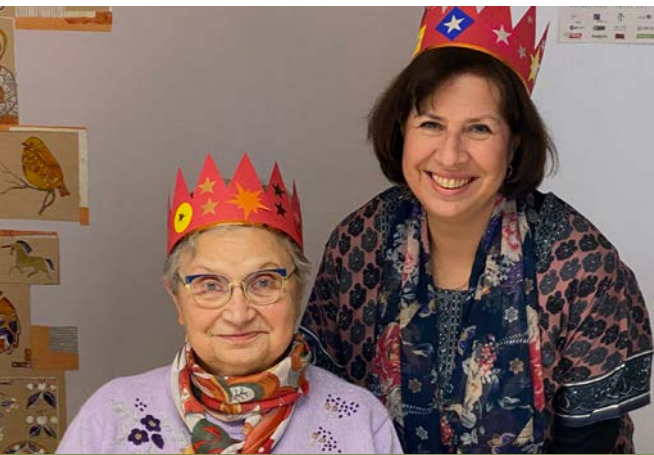
Récré pour tous janvier 25