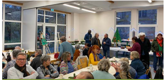
Fête de l'Avent à Erstein