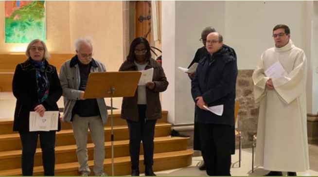
Célébration oecuménique à l'église protestante d'Erstein