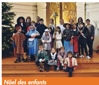
Nöel des enfants