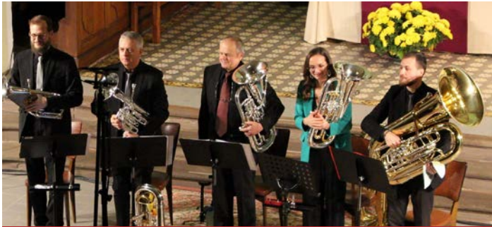
Nebula concert 23 mars